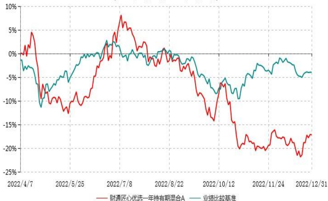
财通匠心优选一年持有期混合A累计净值增长率与业绩比较基准收益率历史走势对比图 (2022年04月07日-2022年12月31日)