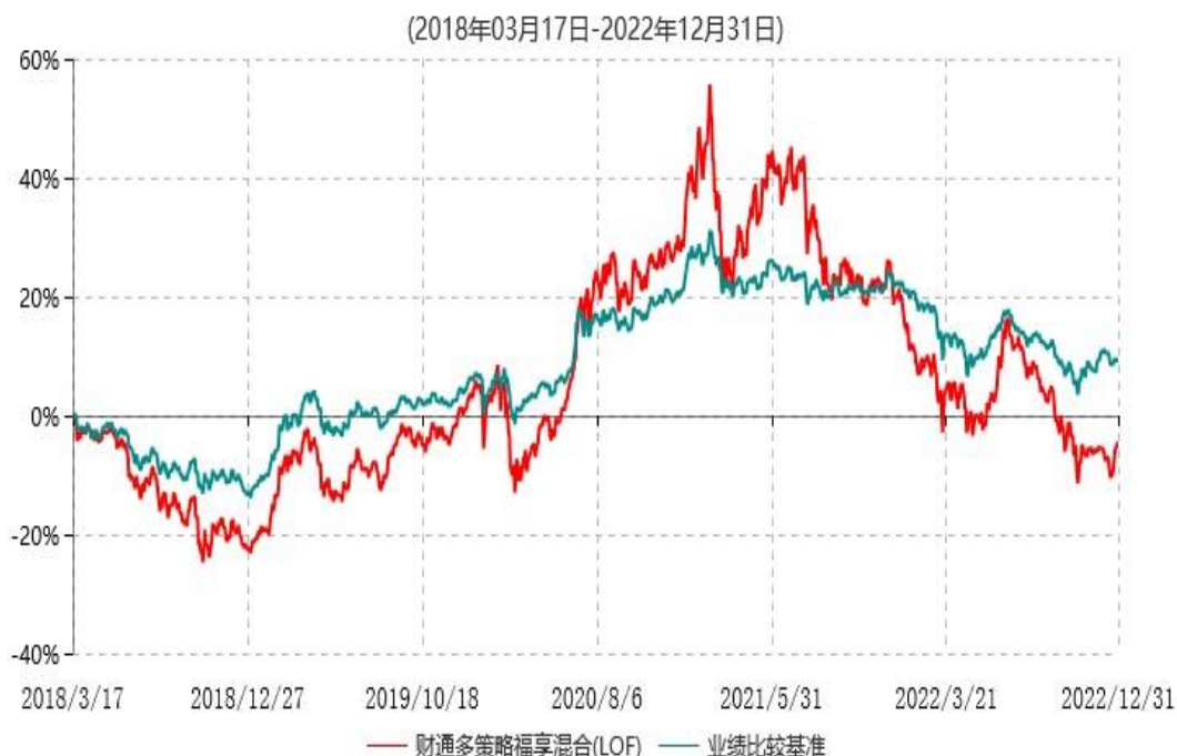
财通多策略福享混合型证券投资基金（LOF）累计净值增长率与业绩比较基准收益率历史走势对比图