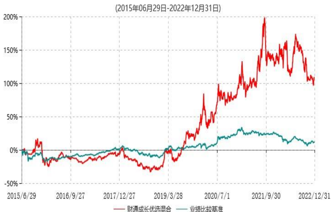
财通成长优选混合型证券投资基金累计净值增长率与业绩比较基准收益率历史走势对比图